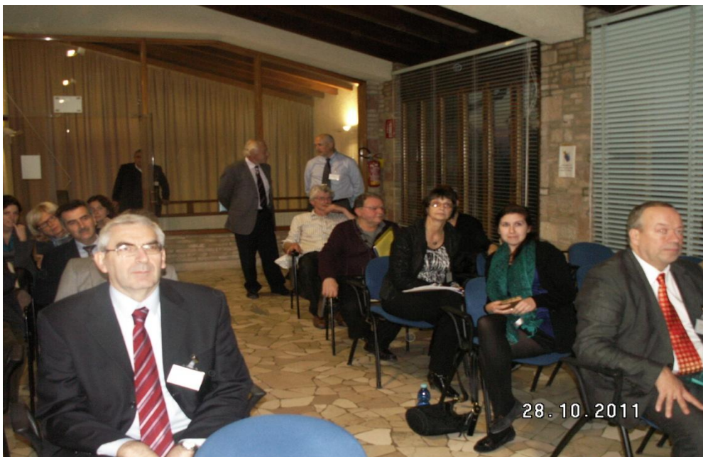
Una sessione del Congresso Adolescence, Person and Health