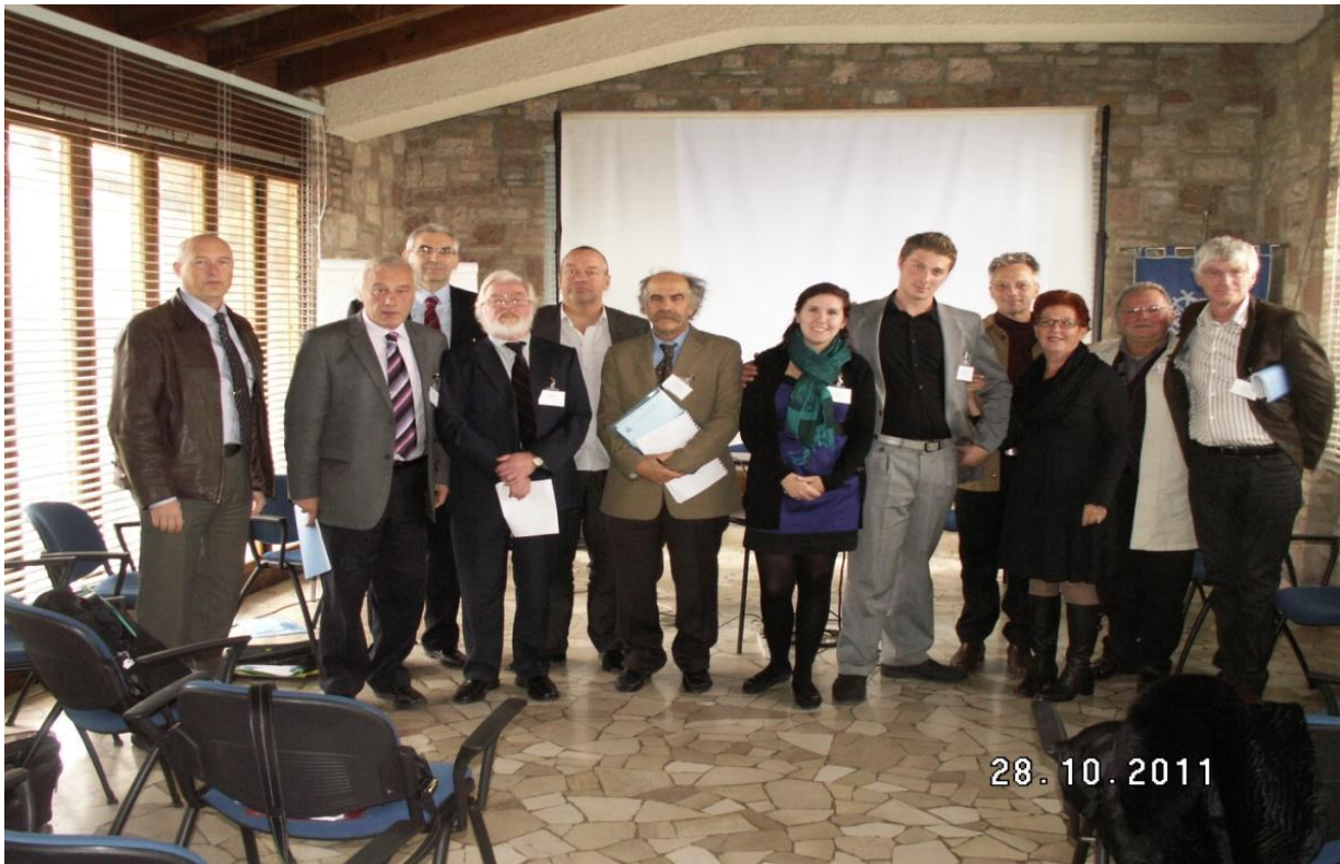
Partecipanti allo workshop promosso dalla World Federation and Society of Adolescentology