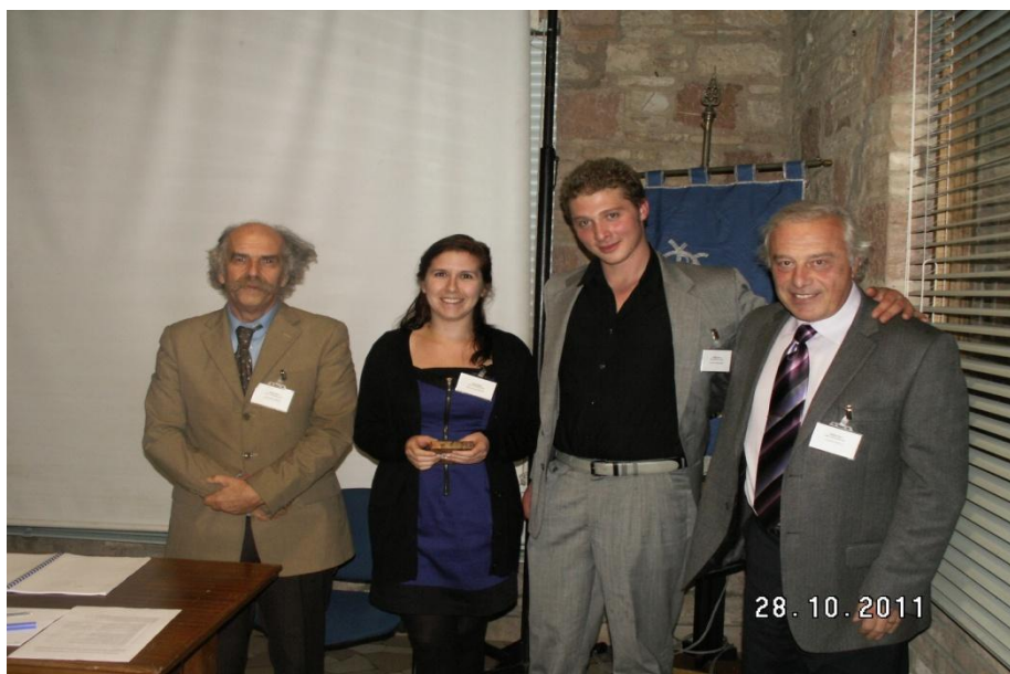
Vincitori del 2012 WFSA Prize per il miglior contributo scientifico (Under 35)