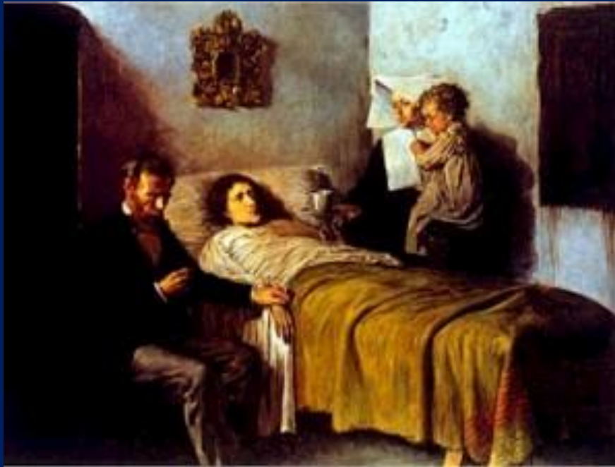
Picasso: Science and Charity